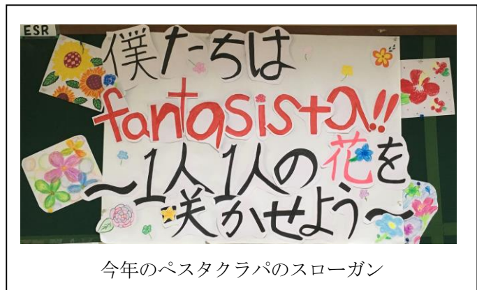
今年のペスタクラパのスローガン

小学部1年生の発表は、「がっこう大好き」。国語、生活科、体育、音楽の中から、学習した内容を選んで発表しました。2年生は、「アイウエオリババ」。昔々のペルシャ国でのお話。『ひらけ、ゴマ!』を唱えると、岩の中から出てきたのはお宝! 可愛いアイウエオリババ5人それぞれの思いを通して、友だちと協力することの大切さを感じさせる可愛い演技でした。3年生は、「Malaysia is a wonderful country!!」。総合的な学習の時間に『大好きマレーシア』というテーマで調べ学習を行ったその成果が見事に表れていました。4年生は、「ヒュードロンお化け学校」。5名という少人数での演劇でしたが、全員一所懸命に演じていた姿がとても素晴らしかったです。5年生は、「ラグビーワールドカップ2019 in JSJ」。5年生11名が日本代表とマレーシア代表に分かれてそれぞれの国の良さを発表し競い合う姿がとても頼もしく感じられました。6年生は、「ぼくらの花子ちゃん戦争」。閉鎖になりそうな小さな動物園で繰り広げられたゾウの花子ちゃんに対する子供たちの純粋で一途な思いが胸を打ちました。最終発表の中学部は、劇「青空へつづる手紙」。小児科病棟で、大きな病を抱えながら懸命に生きる5人の子供たち。厳しい現実には翻弄されながらも、そこから前向きに生きようとする姿を見事に演じきりました。そして、フィナーレを飾る全校合唱「エンジョイコーラス」と続けました。