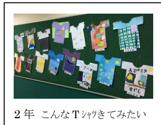
2年 こんなTシャツきてみたい