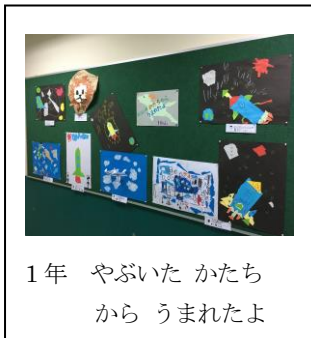
1年 やぶいた かたちから うまれたよ