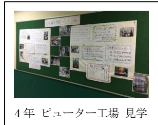
4年 ピューター工場 見学