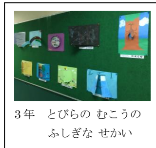
3年 とびらの むこうのふしぎな せかい