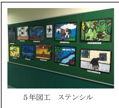
5年 図工 ステンシル